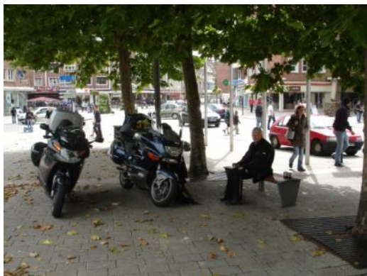
Dunkirk centrum Frankrig

Se nu at komme af sted. Der ligger stadig en mængde oplevelser også til dig.