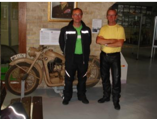
Dunkirk Memorial Frankrig